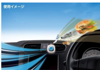
『ファブリーズ クルマ イージークリップ』使用イメージ

「ファブリーズ クルマ イージークリップ」は、P&Gのエアケアブランド「ファブリーズ」の車専用消臭芳香剤です。エアコンの送風口にセットすることで、車内のニオイの原因となる食べ物や汗などの体臭、ペットやエアコン、タバコのニオイなどをしっかり消臭し、車内の快適空間を実現します。ワンタッチで簡単にセットでき、約30日間香りが継続するので、手軽に使えるのも特長のひとつです。自宅の車でのドライブ時のニオイ対策にもおすすめです。